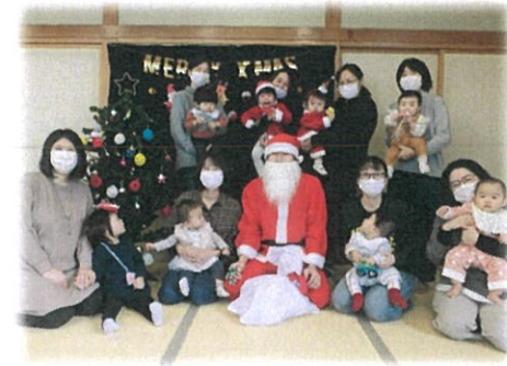
来年度もお子さんや 子育て仲間と一緒に 笑顔いっぱい! 楽しい時間を みんなで 過ごしましょう♪