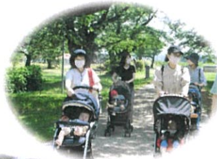
松ヶ岡開墾場を お散歩♪