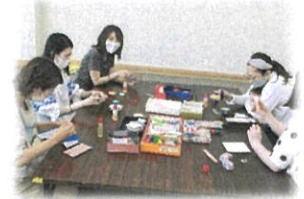
七夕飾りを作って みんなで ☆七夕会☆