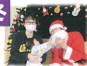
サンタさんと はいチーズ!!