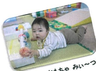
お気に入りのおもちゃ みい～つけ！