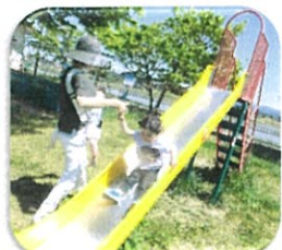
大きいすべり台の楽しい～！