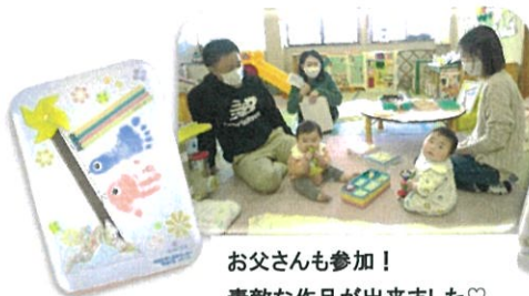
お父さんも参加！ 素敵な作品が出来ました♡