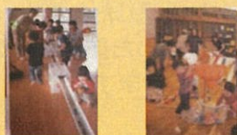
いろいろなボール いろんな仕掛け

11月20日(月) ボールで遊ぼう 時間: 10時～11時 場所: 大山保育園分園ホール 対象: 1歳半～3歳頃の未就園児の親子10組 講師: 勘太郎文庫 大瀧雅士氏 申込: 11月13日(月)まで