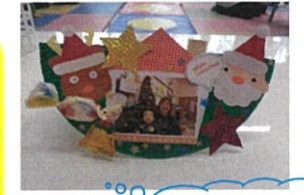
クリスマス飾り ママ達作品