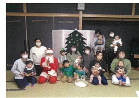
大山よい子ワイワイルーム