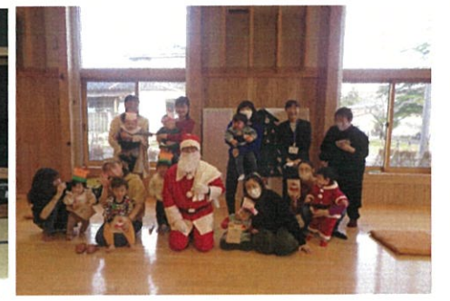
西郷つみきクラブ