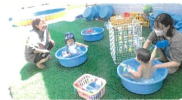
水遊び楽しかったね♡

🎵 …にこにこ広場で触れ合いあそびを 一緒に楽しみましょう♪ 10:30~11:00